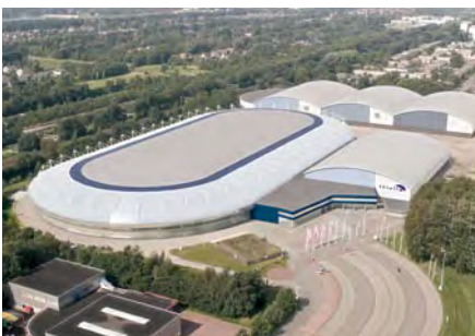
Renovatie Thialf huidige locatie