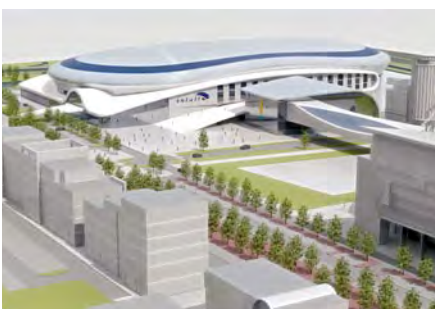
Nieuwbouw Thialf in Sportstadgebied variant Oost/West