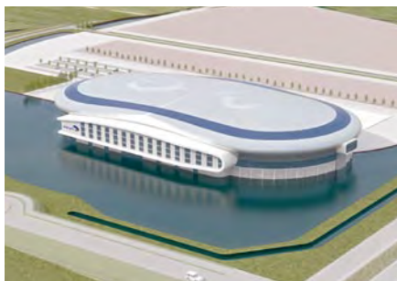
Nieuwbouw Thialf bij afslag A7