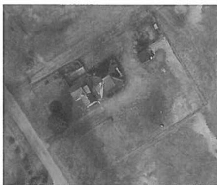
Figuur 3. Luchtfoto Breedsingel 1 Katlijk

Het perceel, waarop dit wijzigingsbesluit betrekking op heeft, heeft een voormalige boerderijpand gestaan. De bebouwing op het perceel bestond uit een woonhuis in één bouwlaag met kap. Het oorspronkelijke woonhuis is aan één zijde uitgebreid. Aan de achterzijde was het woonhuis verbonden met een schuur. De totale oppervlakte van het hoofdgebouw betrof 234 m 2 . De bestaande woning voldeed bouwtechnisch niet aan de eisen van deze tijd.