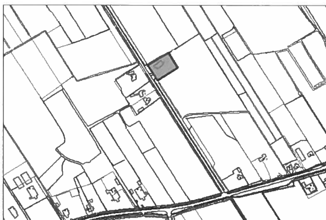
Figuur 1. De ligging van het plangebied

Op onderstaande kaartje is de (globale) locatie van het wijzigingsplan aangegeven.